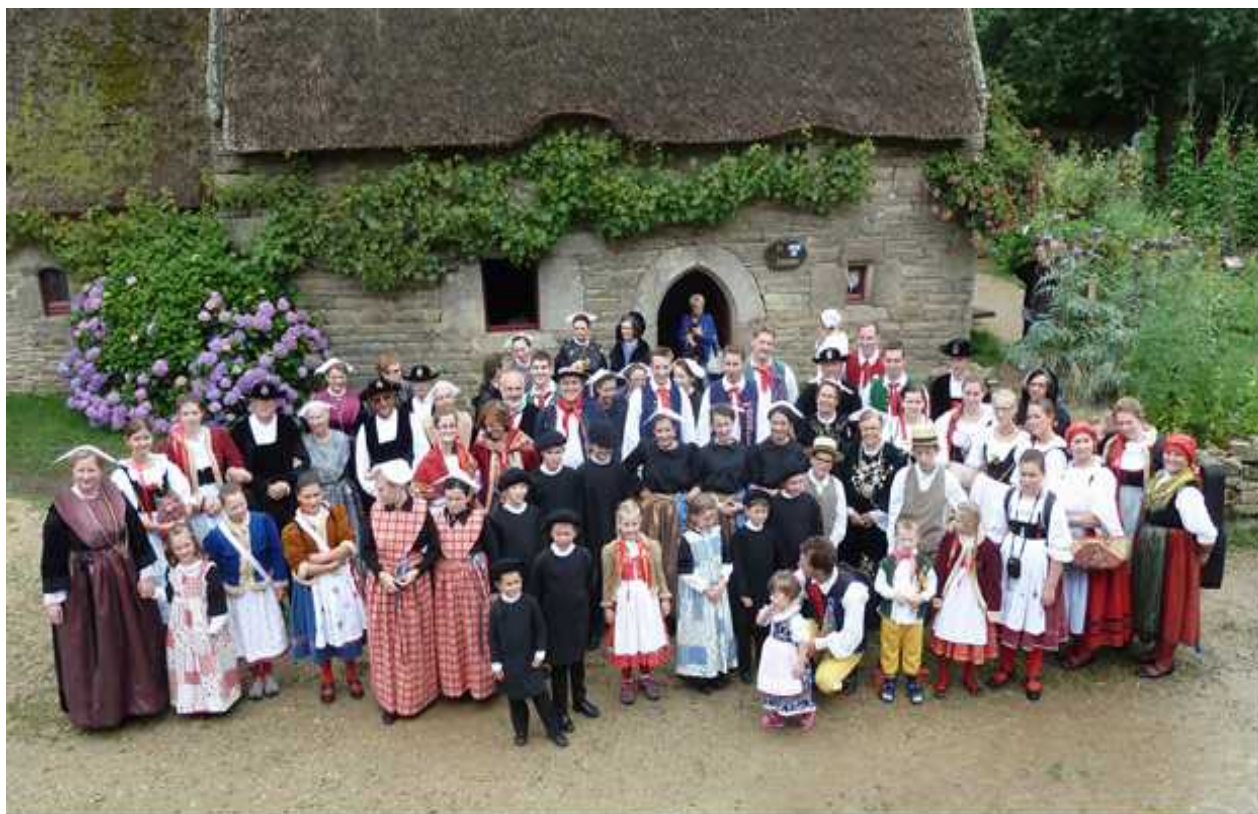
Malý Furiant ve Francii