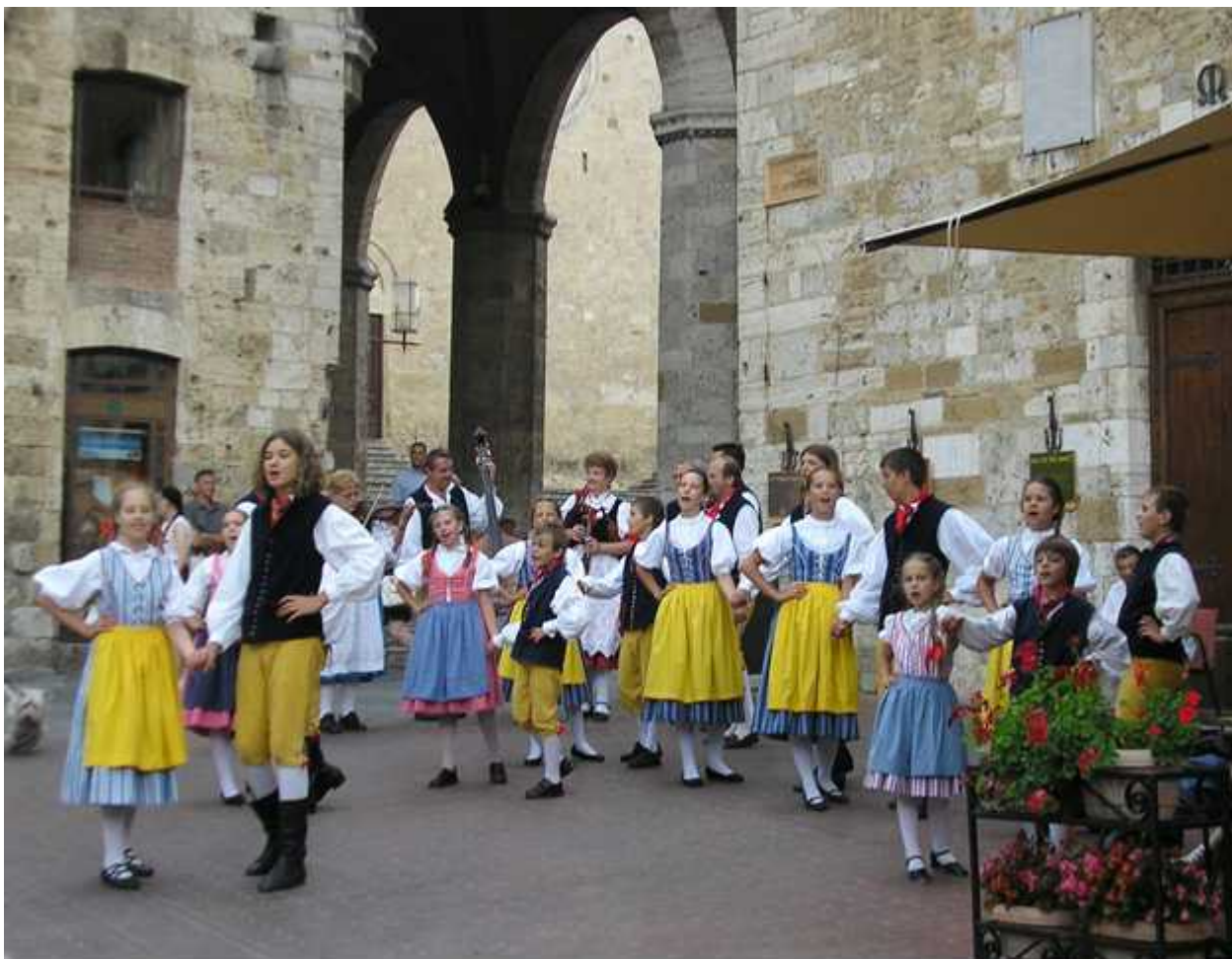
Jitřenka v Toskánsku