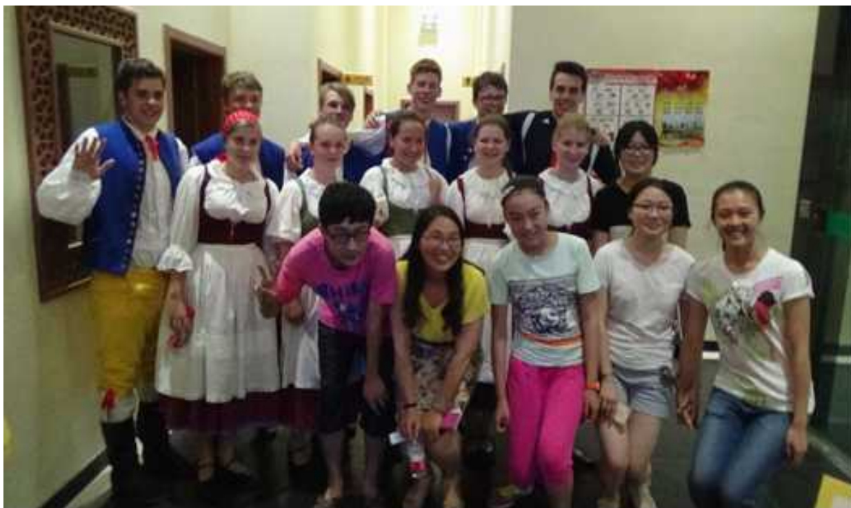
Prácheňáček v Číně