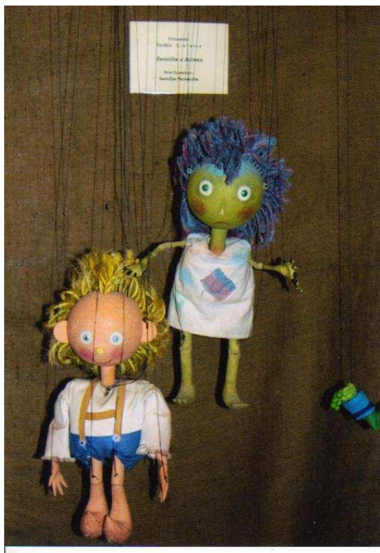
Smolíček a Jezinka